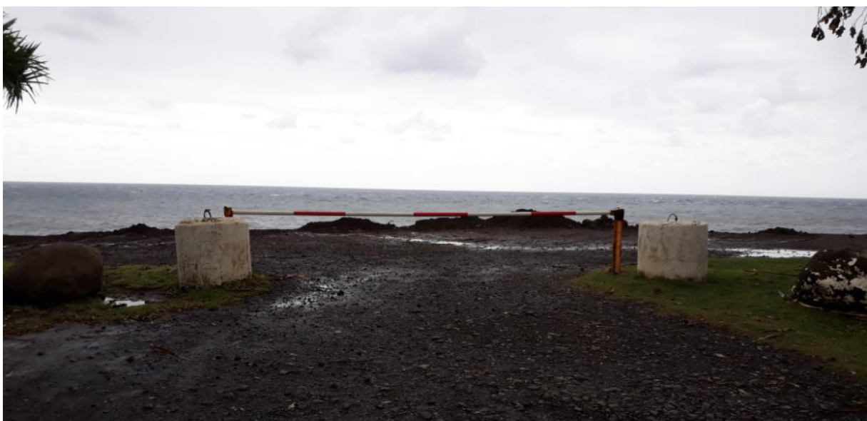
Entrée du site de Champ Borne depuis la route départementale 47 (Saint-André)